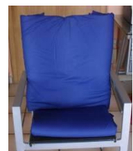
den Stuhl „passend“ machen