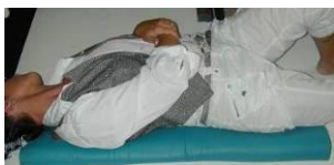
Seitenunterstützung und Mikrolagerung