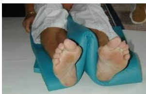
Fersen- und Knöchelentlastung